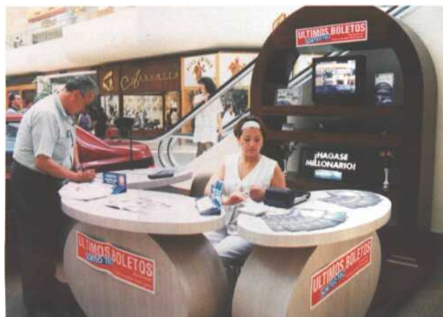
Para algunos compradores es importante el premio, pero saber que se está apoyando a la educación superior es el factor que determina la adquisición del boleto.

La Misión del Tecnológico de Monterrey tiene entre sus objetivos mejorar las comunidades en las que tiene influencia, y son precisamente estas comunidades las que, a través del Sorteo Tec, dan soporte al Instituto para seguir adelante. ●