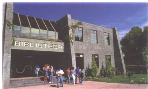
Los recursos obtenidos a través del Sorteo han permitido el crecimiento de la infraestructura del Instituto.