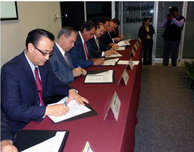
Los Rectores de las Universidades Privadas y los Comisionados de la CTAINL, al signar el convenio.

La Comisión de Transparencia y Acceso a la Información del Estado de Nuevo León, suscribió hoy, un convenio de colaboración con las Universidades TecMilenio, Valle de México, Tecnológica Gral. Mariano Escobedo y Tecnológica Santa Catarina, a través del cual se comprometen a trabajar de manera conjunta para fomentar la cultura de la transparencia y el derecho a la información.