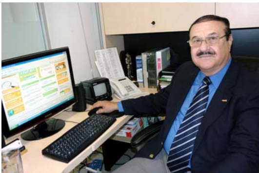
Desde cualquier computadora podrá hacer su trámite.

Agregó que los ciudadanos interesados en recurrir a esta asesoría en línea, serán atendidos en horarios de oficina.